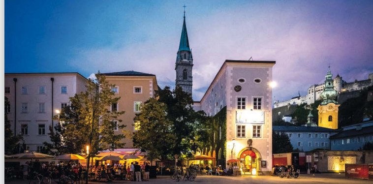
Museo di Arte Moderna Salzburg – Altstadt (Rupertinum)