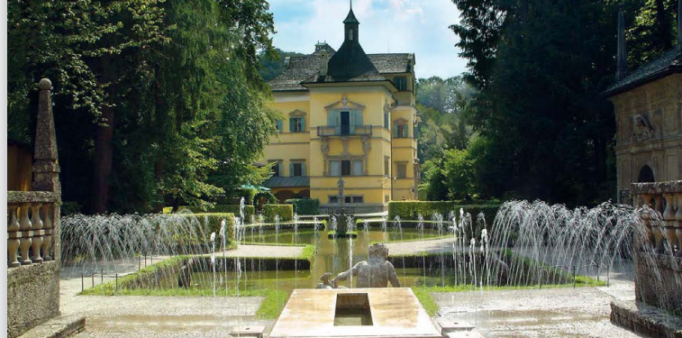
Giochi d'acqua di Hellbrunn

Godetevi la magnifica vista su Salisburgo con la teleferica che vi conduce sull'Untersberg (1853 m).